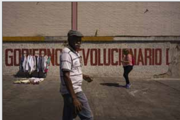
Lauréate du Prix de la Ville de Perpignan Rémi Ochlik 2019