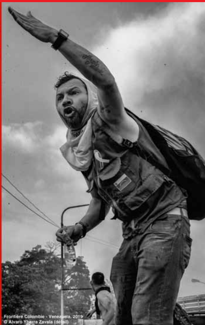
Frontière Colombie - Venezuela, 2019 (détail)