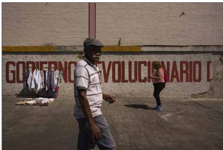
Lauréate du Prix de la Ville de Perpignan Rémi Ochlik 2019

L'effondrement du Venezuela a des causes et des effets mesurables et bien connus. Les Vénézuéliens constituent aujourd'hui l'une des plus grandes populations de réfugiés au monde. La criminalité et l'inflation ont atteint des sommets, les salaires sont bas et la pauvreté élevée. Le pays détient le record des reines de beauté couronnées et affiche de forts taux de grossesses adolescentes. Tandis que des millions fuient, d'autres tentent de survivre. Les chiffres seuls ne peuvent pas traduire ce que l'on ressent quand on voit son pays s'écrouler. Paradis perdu est un témoignage photographique d'un pays qui sombre dans le chaos.