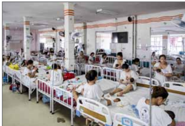
© Kasia Strek / Item Lauréate du Prix Camille Lepage 2018

En 2018, l'IVG était toujours interdite ou extrêmement restreinte dans 123 pays. Selon l'OMS, chaque année, plus de 25 millions d'avortements, soit la moitié de toutes les procédures recensées dans le monde, sont considérés comme dangereux, et environ 160 femmes meurent chaque jour des suites d'avortements à risque.