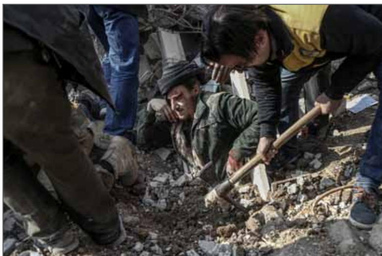
Lauréat du Visa d'or humanitaire du Comité international de la Croix-Rouge (CICR) 2019

Jusqu'à fin mars 2018, les bombes du gouvernement syrien, soutenu par la Russie, continuaient de tomber sur les villes et les villages de la Ghouta orientale, sans répit, semant la peur et la destruction comme jamais depuis le début du siège en 2013. En l'espace de deux mois à peine, le paysage a été complètement transformé. Les civils innocents ne pouvaient pas quitter les abris pour mener leur vie quotidienne. Ceux qui ont tenté d'en sortir l'ont parfois payé de leur vie.