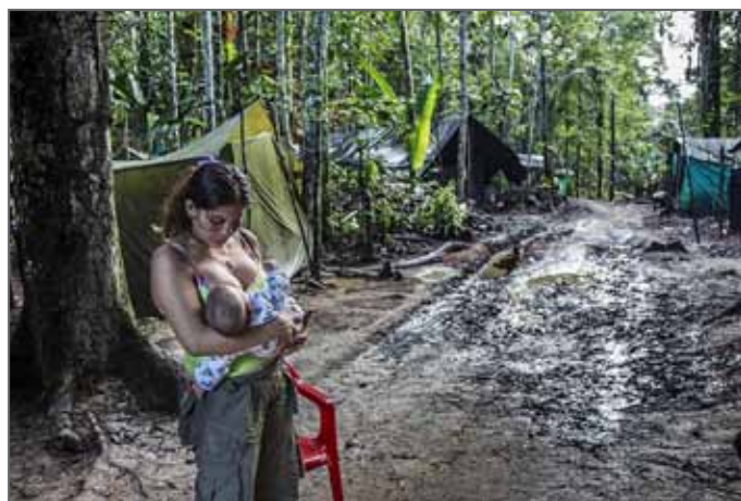
Lauréate du Prix Canon de la Femme Photojournaliste 2017