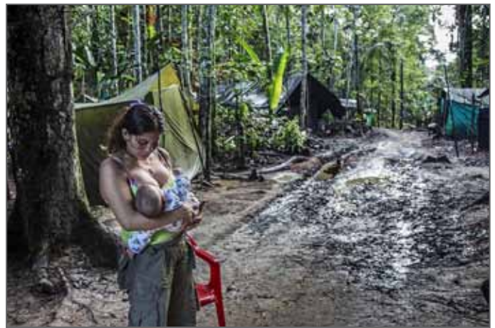
Ganadora del Premio Canon de la Mujer Fotoperiodista 2017