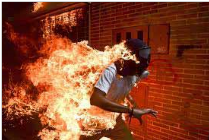
© Ronaldo Schemidt - World Press Photo of the Year

Podréis ver este concurso, referente mundial del fotoperiodismo, en un espacio de exposición privilegiado de Perpiñán.