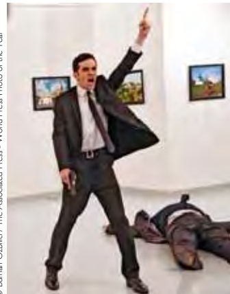
© Burhan Ozbilic / The Associated Press - World Press Photo of the Year